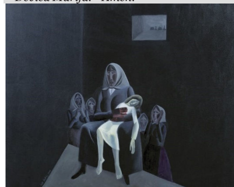
Ive Šubic, Dražgoška piéta, olje na platnu, 80 x 100 cm, 1977

Z ljublim Sinom nas blagoslovi Devica Marija. * Amen.