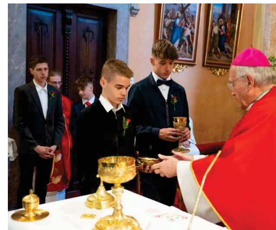
Škof pri oltarju sprejema darove za sv. mašo, foto: Janez Tolar

Župnija Železniki, Trnje 23, 4228 Železniki, tel. župnišče: 04/510-2100, župnik: 031/860-126, e-pošta: zupnija.zelezniki@rkc.si , Šplet: http://www.obcestvo.si/ , TRR: 0700 0000 0898 116, Župnija Zali Log, Zali Log 23, 4228 Železniki, TRR: 0700 0000 1479 631, Župnija Dražgoše, Dražgoše nn, 4228 Železniki, TRR: 0700 0000 1479 728, Antonov vrtec: Škovine 1, 04/510-2500, 041/63-10-93, Župnijska Karitas Železniki, Trnje 23, 4228 Železniki, telefon (tajnica): 051/241-254, TRR: SI56 0700 0000 1031 394, Občestvo je interno glasilo župnij: Dražgoše, Zali Log in Železniki. Odgovarja: Tine Skok, župnik.